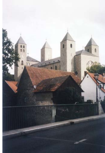
Abadía de Münsterschwarzach