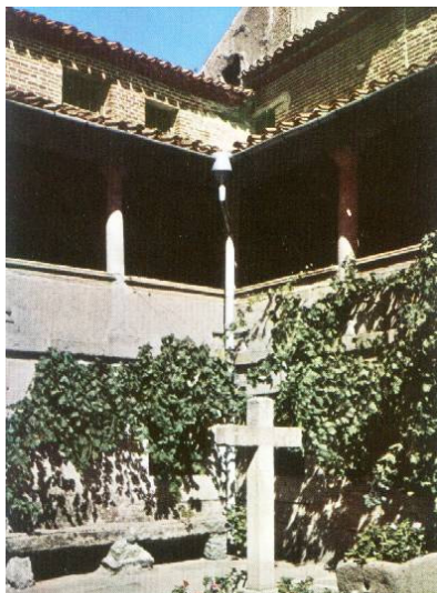
Claustro, Monasterio de San José. Ávila

La nueva comunidad que Teresa pone en marcha en San José carece totalmente del carácter de rebeldía frente a su monasterio de origen de La Encarnación. Me parece muy importante subrayar este hecho porque no pocas veces se toma a Teresa como ejemplo para innovaciones de tipo contestatario. Ella misma asegura en varios lugares que no deja su comunidad por descontento, sino porque comprende que Dios le confía una misión dentro de la familia del Carmelo. Cuando la Santa relata las tentaciones que la acometieron justo al acabar de fundar el convento de San José, dice: “También me ponía el demonio....que cómo había de poder sufrir tanta penitencia y dejaba casa tan grande y deleitosa y adonde tan contenta siempre había estado, y tantas amigas, que quizá las de acá no serían a mi gusto...” (V 36,8) y en una carta al P. Jerónimo Gracián confiesa: